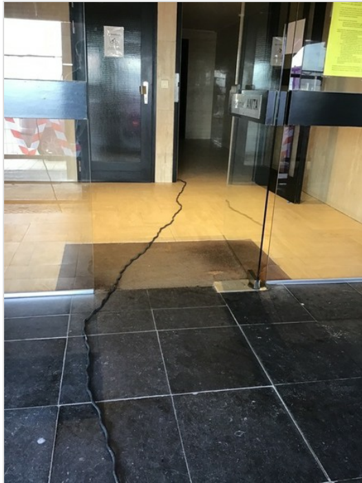
Elektriciteit wordt op heden via de gang(gemene delen) afgetakt