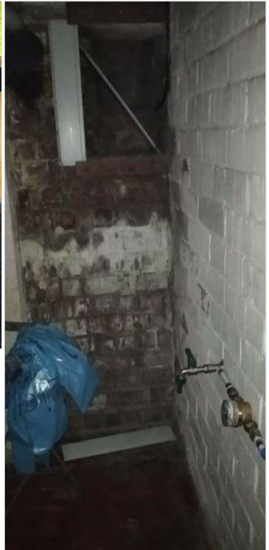
water + teller werd voorzien