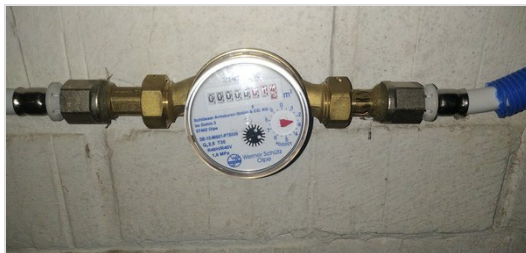
tellerstand water op 18/09: 00000,014m 3