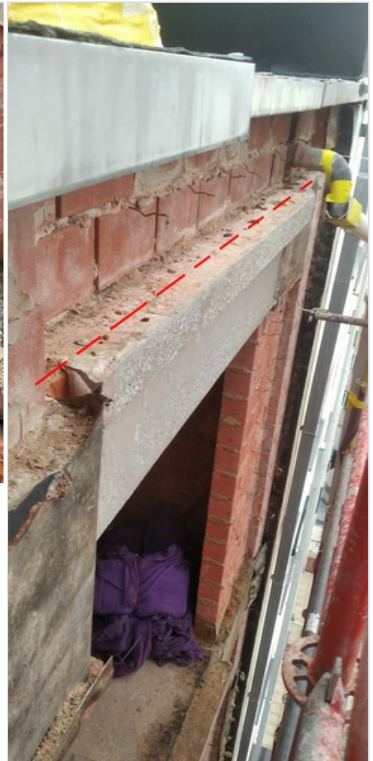
afslippen beton lip