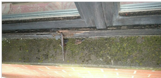
Staat van te behouden buitenschrijnwerk te evalueren

Meest recente optie lijst werd digitaal toegevoegd als bijlage aan dit verslag.