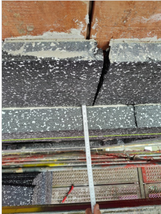
2e laag : 10cm

Stand van zaken ifv uitdijking wandvlak werd 2de laag isolatie geplaatst.