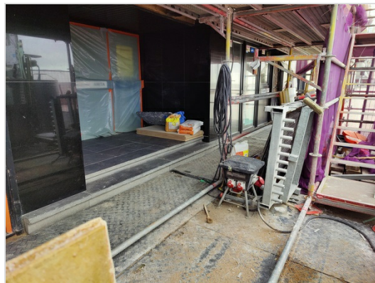
Publiek afsluiten van werf

De werf dient hierbij volledig wind- & storm veilig gemaakt te worden; ARCH verwijst hier specifiek naar losliggend (werk)materiaal.