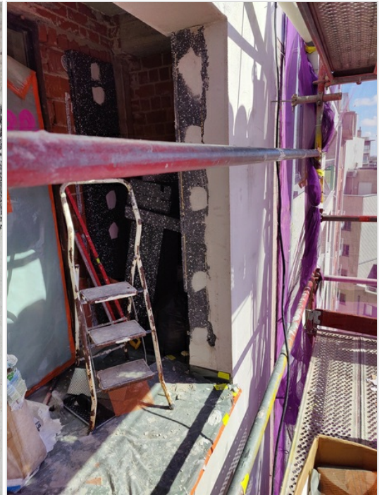
Waterdichting optrekken | WV 24 - 24.4