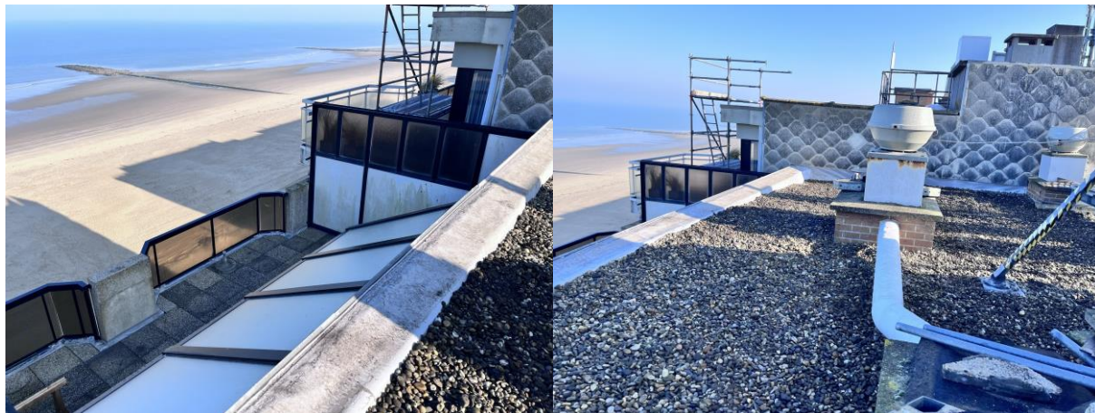
De tegels op dragers op de terrassen, en de keien op het hoofddak zijn teruggelegd ...