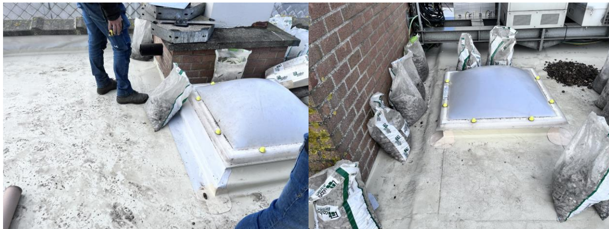
Ter hoogte van de koepels is de dichting in opstand opgetrokken, en zijn passtukken voorzien aan de hoeken ...