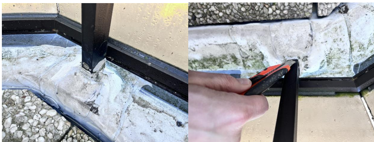
Ter hoogte van de balustradevoeten is nog risico op infiltraties ...

Eerder gemaakte opmerkingen door de aannemer te bevestigen dat ze uitgevoerd of aangepast werden.