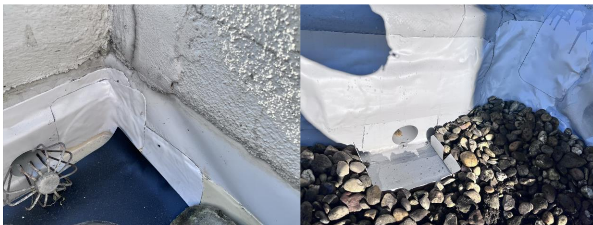
Nieuwe tapbuizen zijn gestoken en aangewerkt, dichting is aangewerkt op de oude opstanden ...