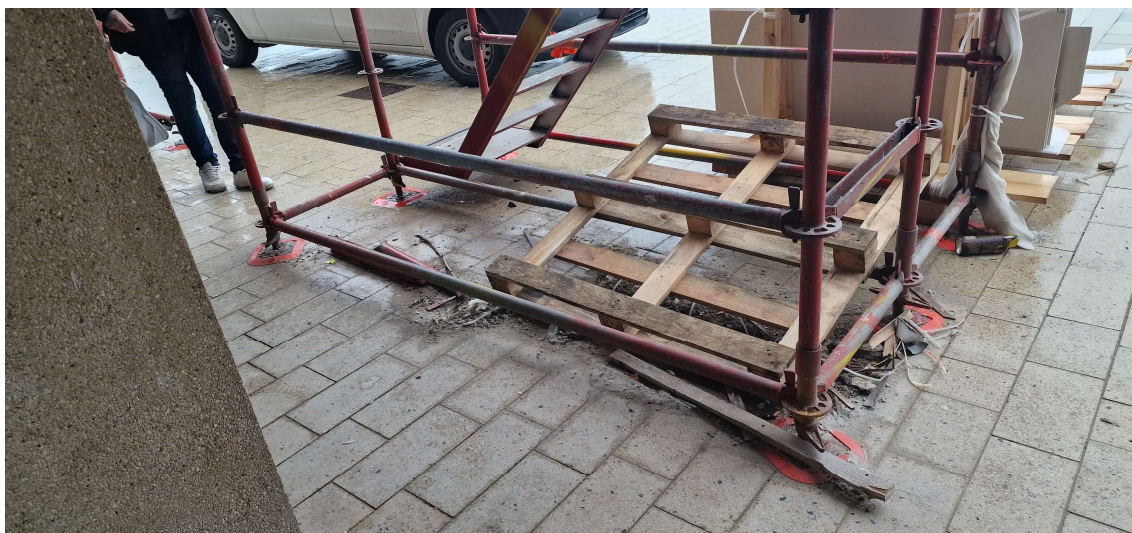
Orde en netheid: op te kuisen

Eerder gemaakte opmerkingen door de aannemer te bevestigen dat ze uitgevoerd of aangepast werden.