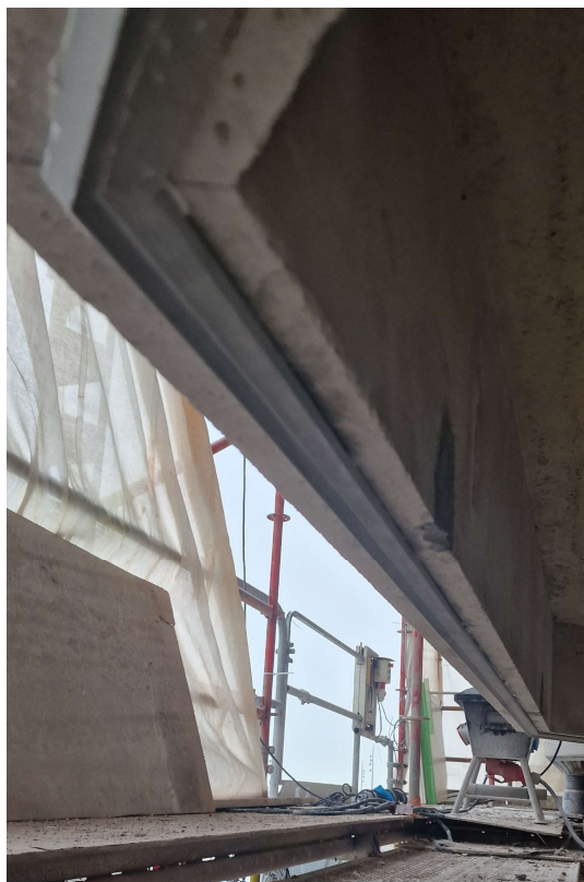
Frontpaneel gelijkvloers (inkom) ingekort