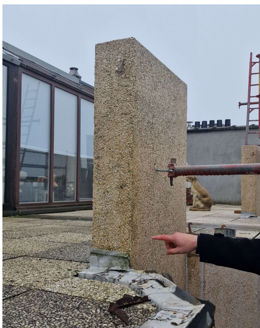
Betonnen opstand te voorzien van afdekkap

Eerder gemaakte opmerkingen door de aannemer te bevestigen dat ze uitgevoerd of aangepast werden.