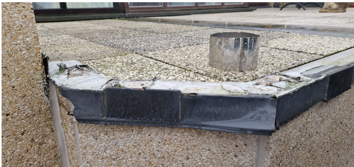
Dakrand dringend (tijdelijk) af te dichten