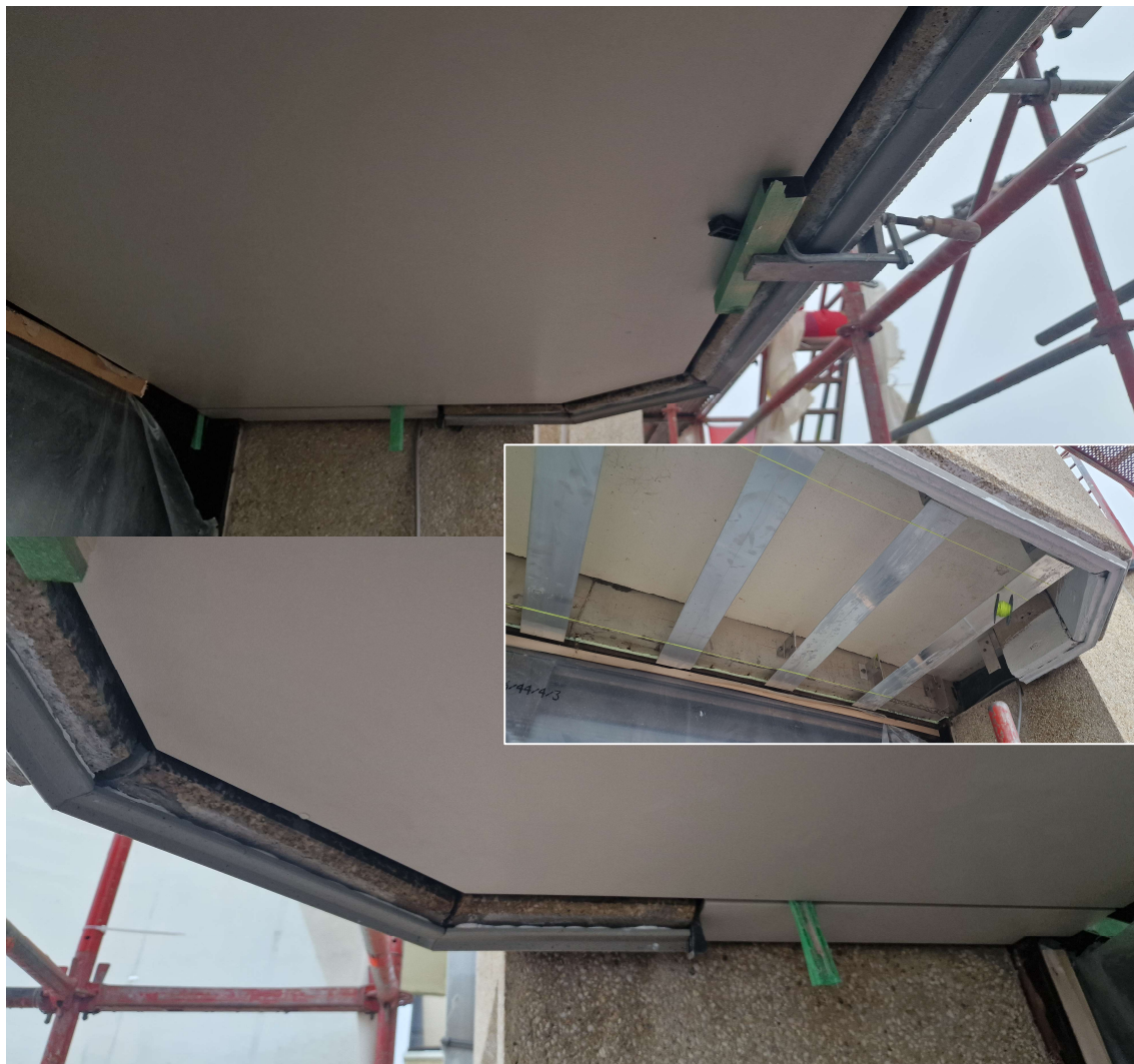
Plaatsing Dekton op draagstructuur

Eerder gemaakte opmerkingen door de aannemer te bevestigen dat ze uitgevoerd of aangepast werden.