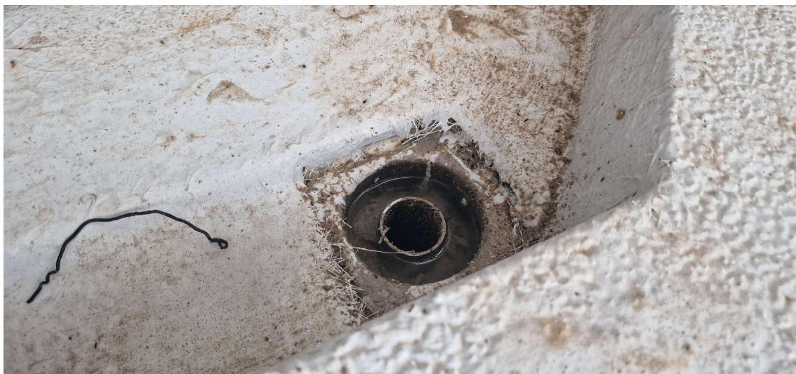
Uitstekende vezels te verwijderen voor aanbrengen 2 e laag PU