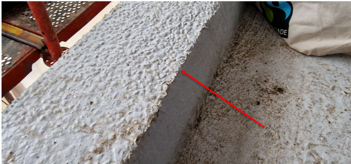
Vlies opgetrokken tot bovenzijde opstand

Eerder gemaakte opmerkingen door de aannemer te bevestigen dat ze uitgevoerd of aangepast werden.