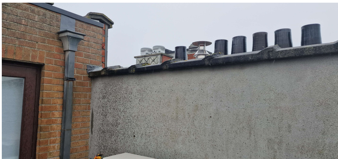
Scheidingsmuur te voorzien van afdekkap ivf. nieuwe ETICS