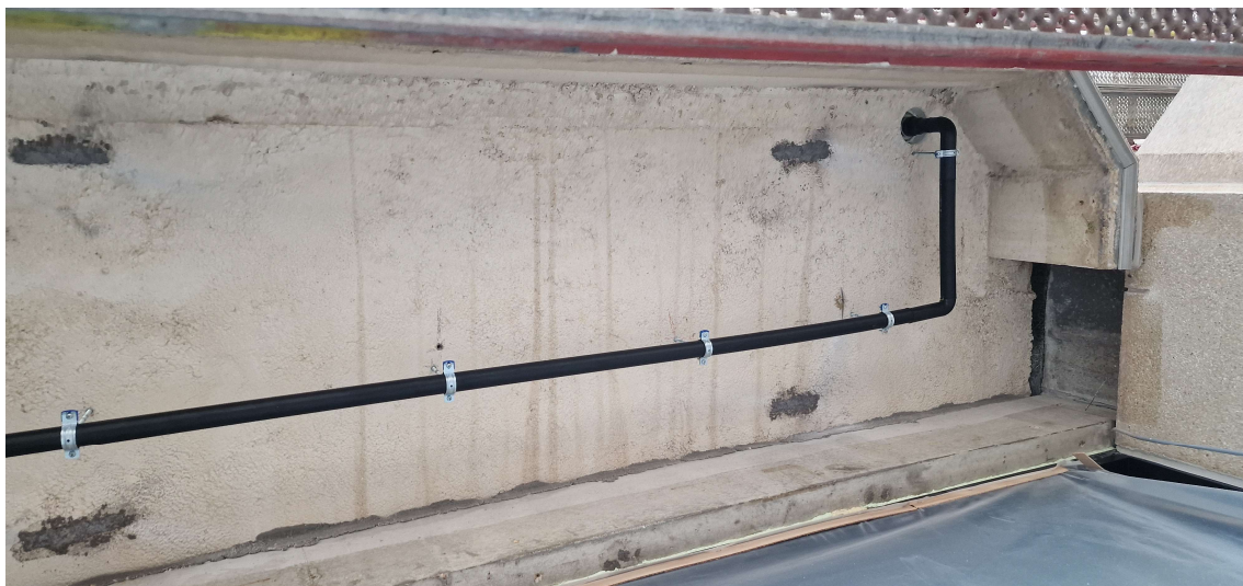
Betonherstelling van oude ankerpunten uitgevoerd

Eerder gemaakte opmerkingen door de aannemer te bevestigen dat ze uitgevoerd of aangepast werden.