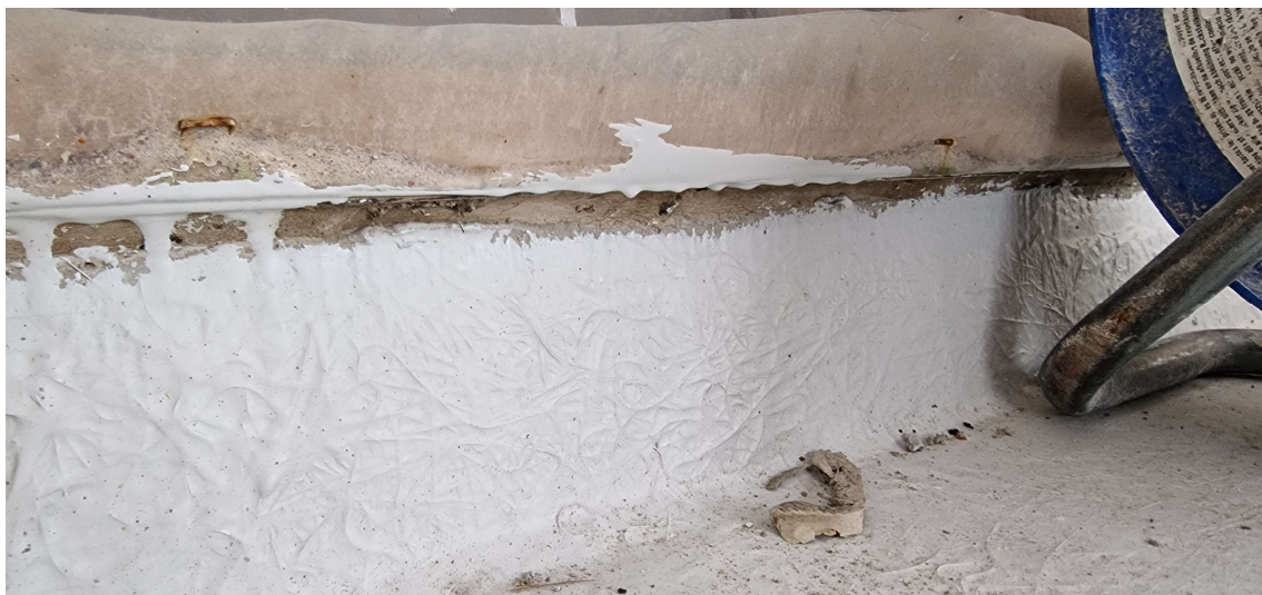
Aandacht voor correct aanwerken waterdichting onder de ramen

Eerder gemaakte opmerkingen door de aannemer te bevestigen dat ze uitgevoerd of aangepast werden.