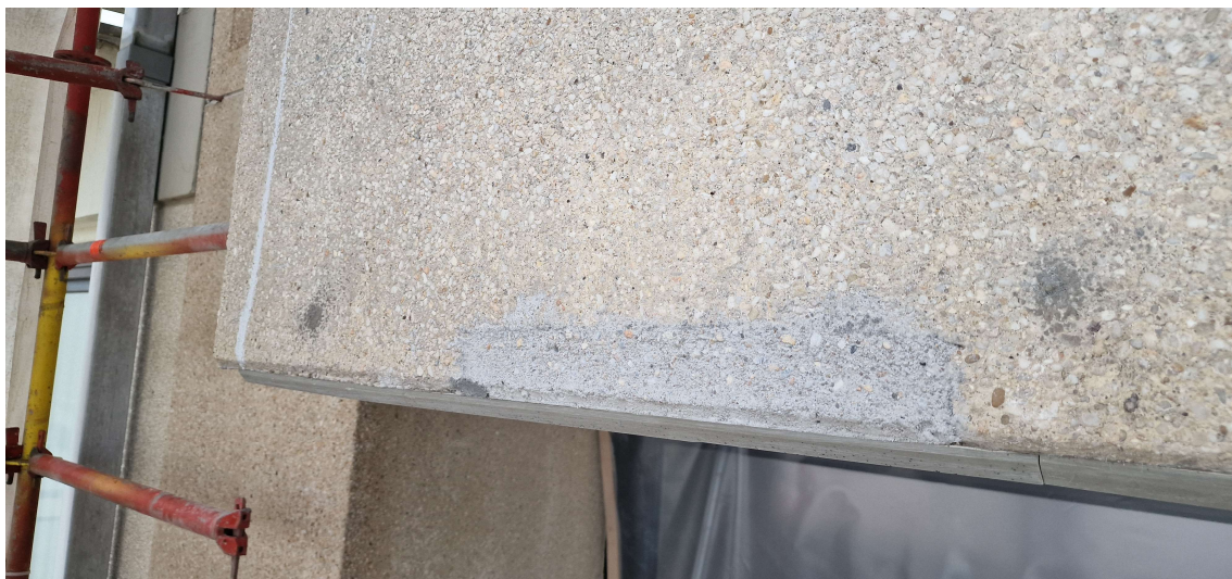
Correct uitgevoerde betonherstellingen