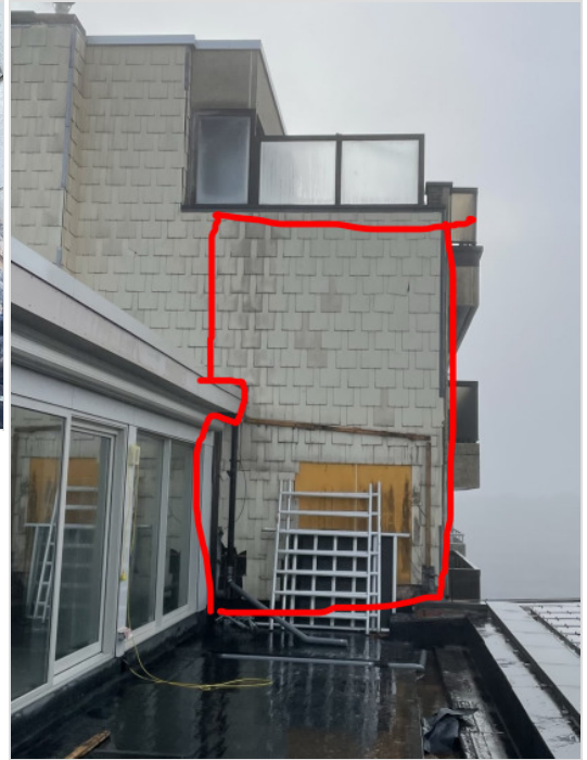
te isoleren deel en te vernieuwen leien