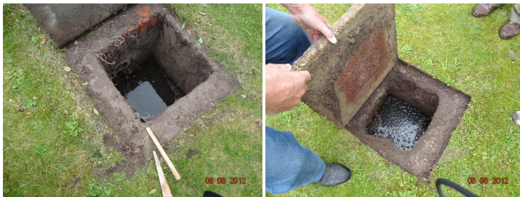
Zicht op inspectieput / septische put na openen van deksel