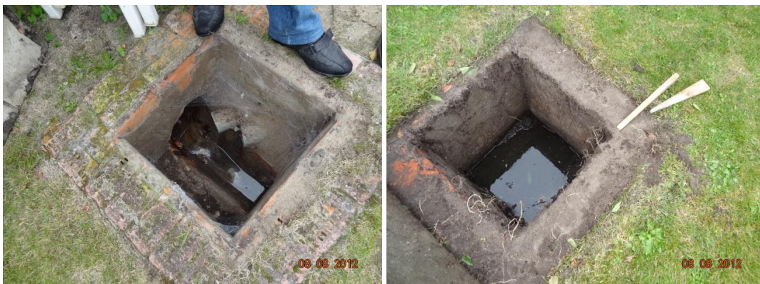
Zicht op inspectieput / septische put na openen van deksel