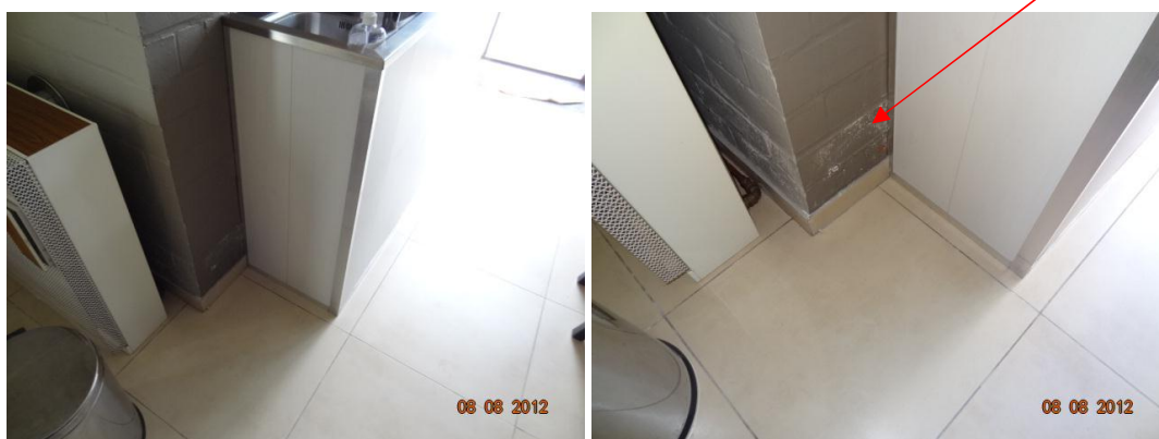
Zicht op vermelde vochtschade in huisnr. 38