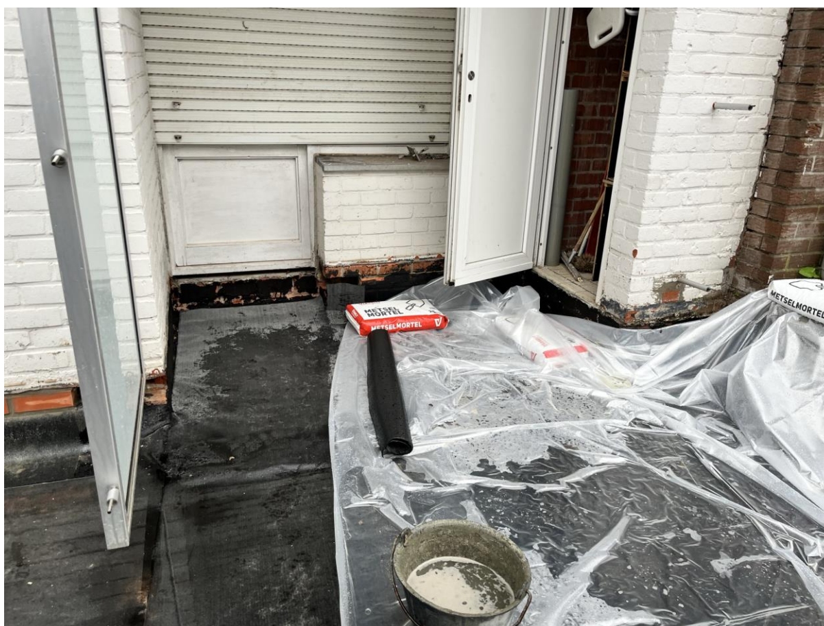
Ter hoogte van de deur rechts is de betonplaat iets hoger aangestort dan de rest van het dakvlak, hier zal men 10 cm isolatie in plaats van 12 cm aanbrengen ...

Eerder gemaakte opmerkingen door de aannemer te bevestigen dat ze uitgevoerd of aangepast werden.