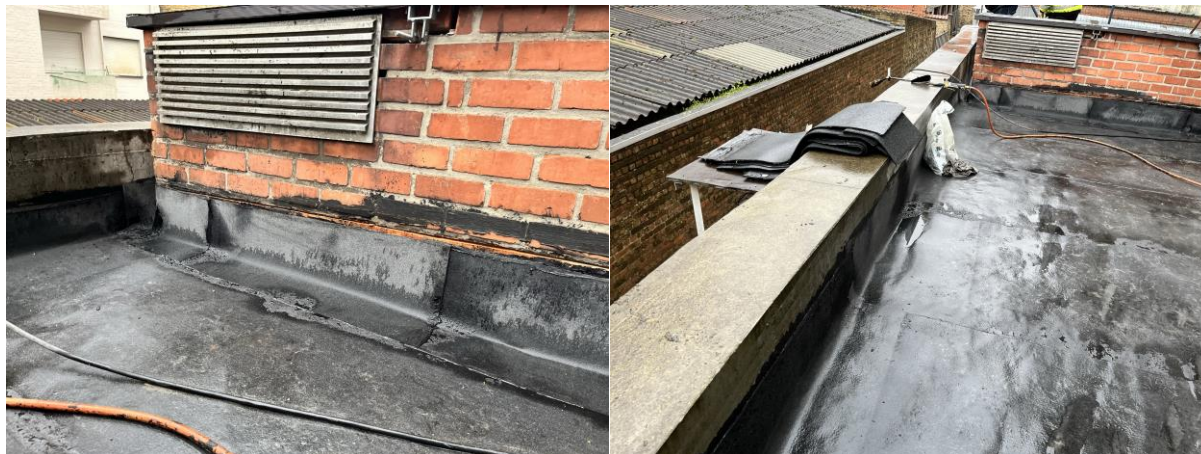
De dichting wordt volledig opgetrokken op de koper en tot op de betonnen dakrand ...